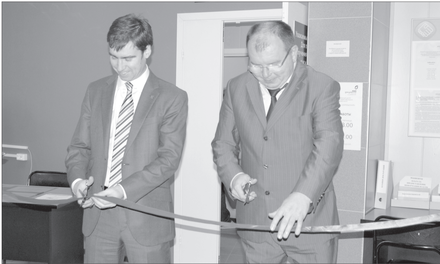
9 СЕНТЯБРЯ 2015 ГОДА, Г.КИРИШИ. Вчера вице-губернатор Дмитрий Ялов (слева) и глава районной администрации Константин Тимофеев открыли в нашем городе многофункциональный центр.