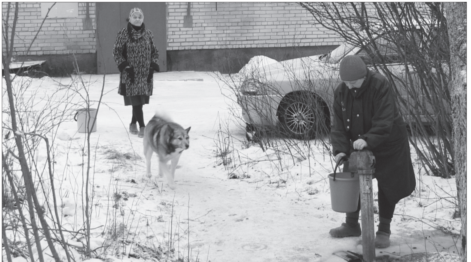
БУДОГОЩЬ, 10 ЯНВАРЯ. Колонка на улице Кооперативной, 28 сейчас работает нормально. А в морозные дни замерзшую колонку пришлось отогреть горячей водой.