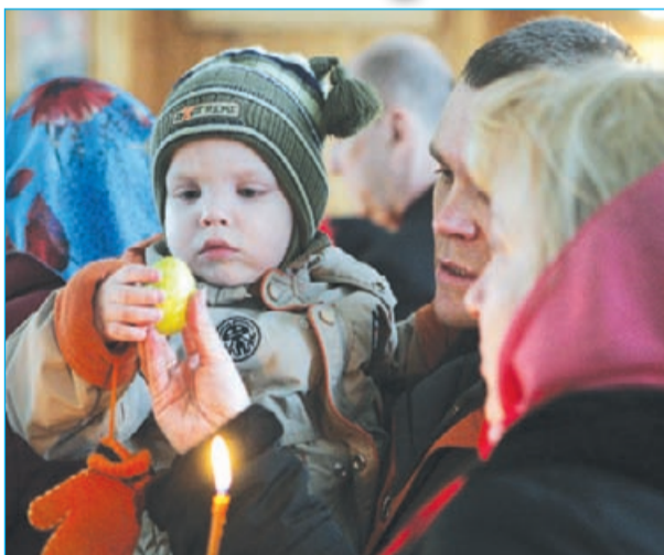
● Пасхальное богослужение в Свято-Троицкой церкви города Кириши запечатлел фотокорреспондент Роман ХРАМОВНИК.