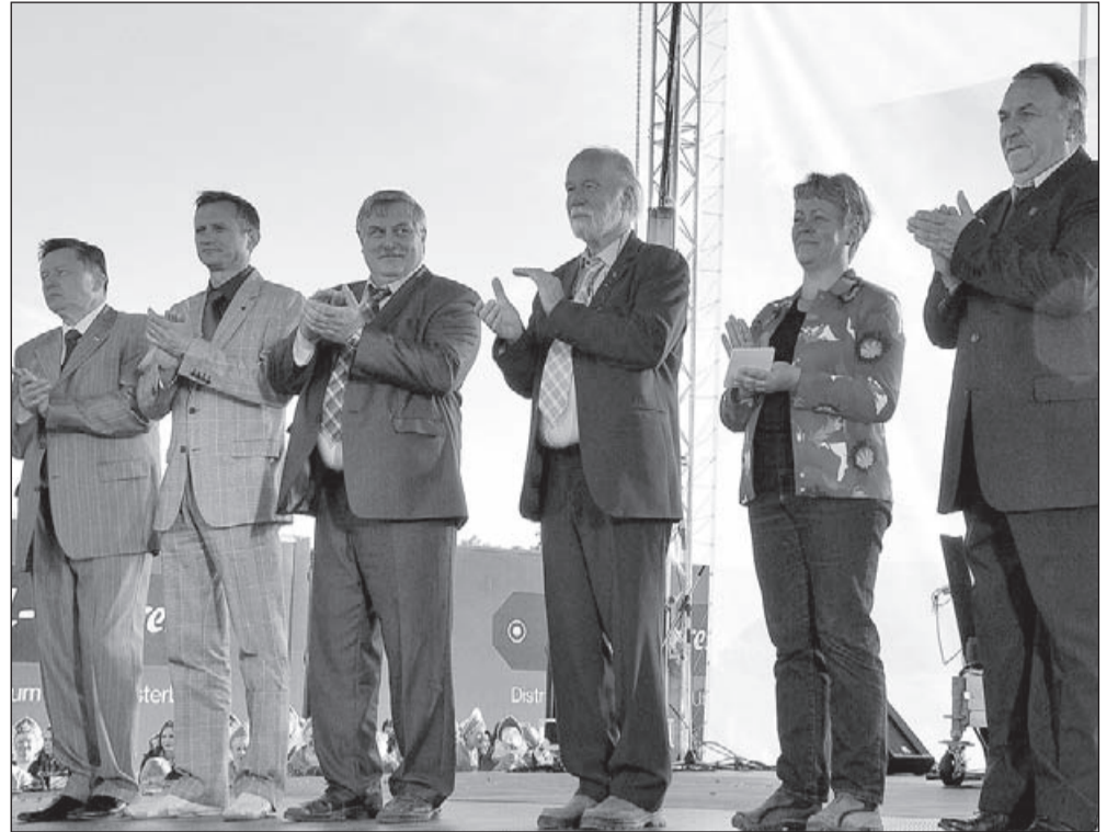
● Делегаты городов-побратимов на праздновании Дня города. 2008 год.