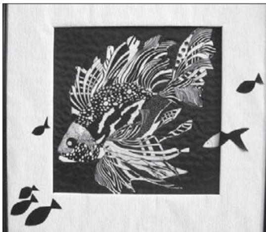
● Работы Олеси Поздняковой.