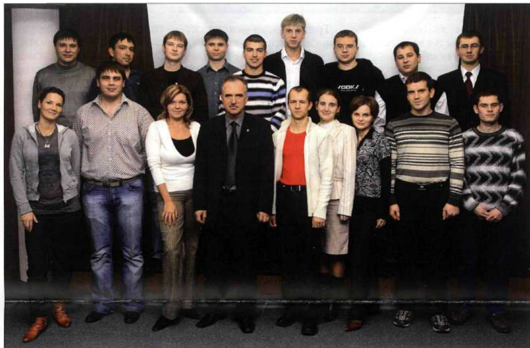
С каждой такой встречей молодежь завода обретает новых друзей.

Несмотря на различия в деятельности наших производств (например, разная глубина переработки нефти и ассортимент выпускаемой продукции), профиль обоих предприятий — нефтепереработка. Поэтому