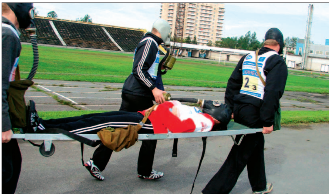
На снимке: на каждом этапе соревнований нужны были и знания, и сноровка.

приняло участие девять команд. Каждая состояла из четы-