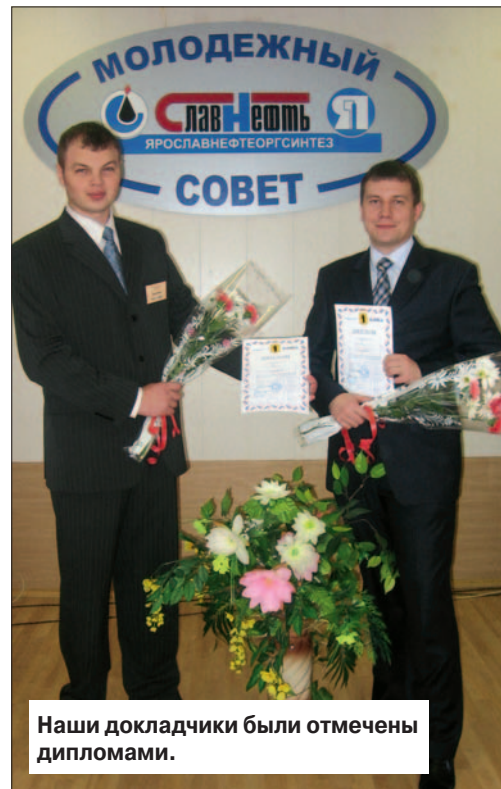
Наши докладчики были отмечены дипломами.

Второй день нашего пребывания завершился экскурсией по прекрасному историческому центру города Ярославля, который готовится в 2010 году отметить свое 1000-летие.